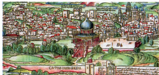
Mapa della città di Gerusalemme, da "Peregrinatio in Terram Sanctam" di Bernhard von Breydenbach (1440-1497). Acquaforte di Erhard Reuwich (ca.1488).